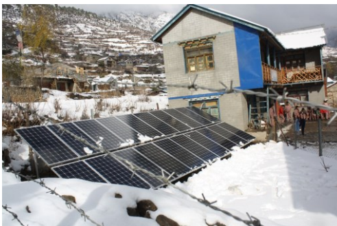
20 geïnstalleerde zonnepanelen met op de achtergrond Head Enable Home in Simikot

met 2 belangrijke Nederlandse sponsors, te weten Stichting Wilde Ganzen (Hilversum) en de Unica Foundation (Hoevelaken).