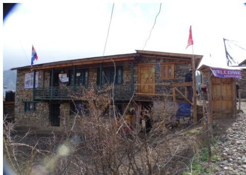
Head Vision Home is een scholings-/trainingscentrum (in braille, Engels, ict, daily skills en zelfvertrouwen), maar biedt ook onderdak aan plm. 25 blinde/zeer slechtziende kinderen incl. 'house father and -mother'