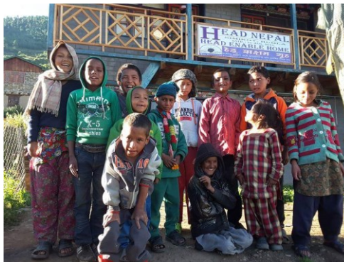
De eerste kinderen van HEAD ENABLE HOME

gehandicapte kinderen worden opgevangen en begeleid. SNG heeft tot 1 juli 2017 diverse noodzakelijke kostenposten gesponsord, zoals de huur van HEH, de home 'mother', de conciërge/toezichthouder/home 'father' en kantoorbenodigdheden en hygiënische materialen.