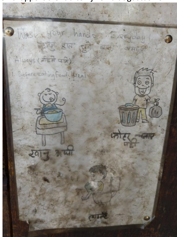
wash your hands every day!