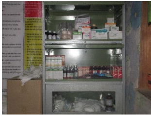
De medicijnkast met hulp- en verbandmiddelen