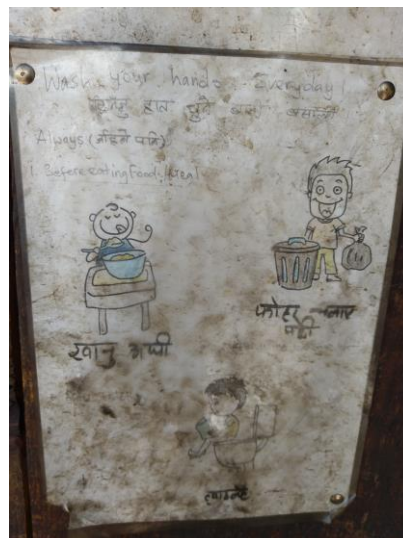
wash your hands every day!